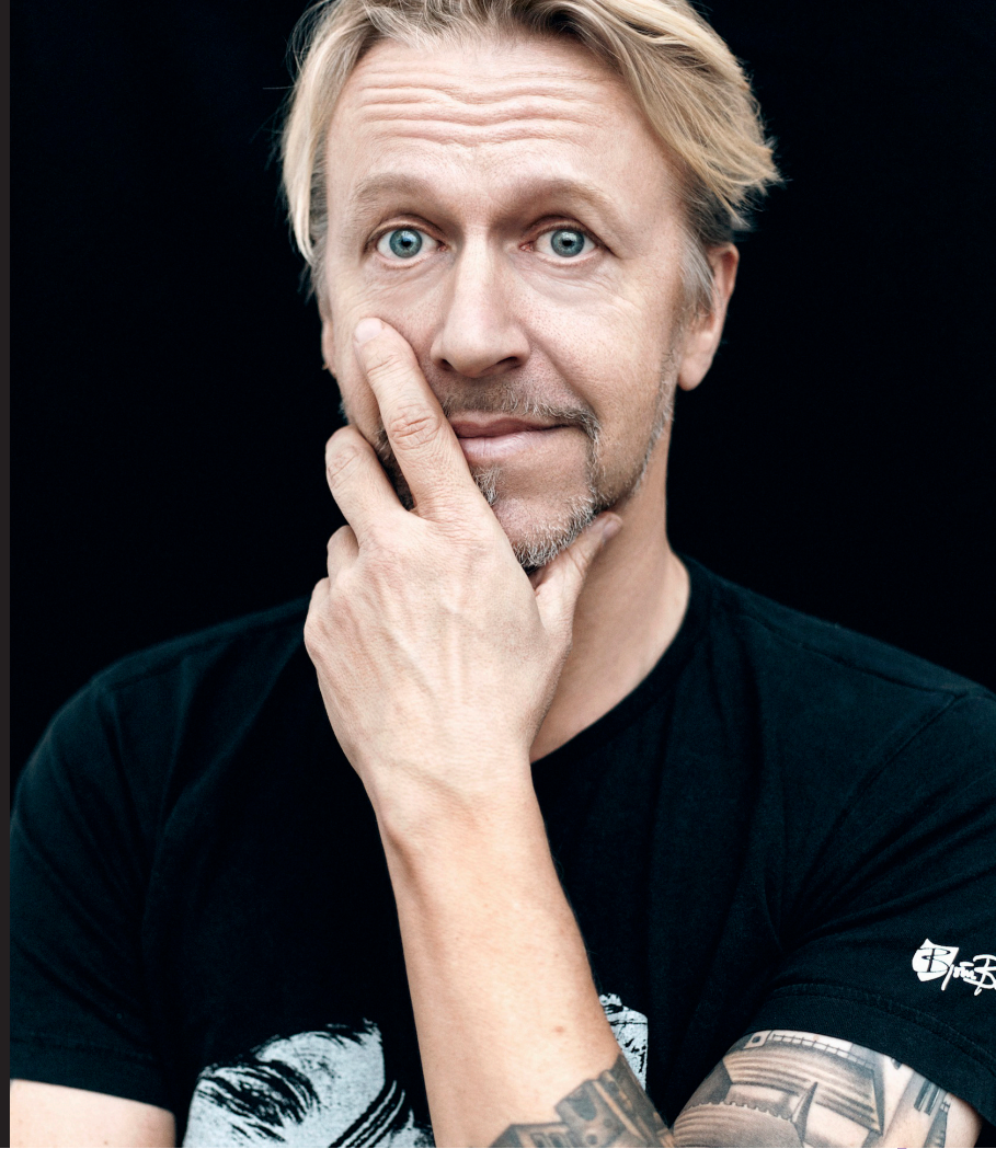
Bilden är beskuren.

Ernst Billgren konstnär och medlem i Bildupphovsrätt